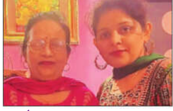
घरेलू कलह से परेशान था आरोपी। वारदात के बाद बच्चों को लेकर फरार आरोपी को पुलिस ने किया गिरफ्तार।